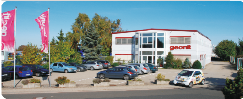
geonit - Haupthaus in Bad Kreuznach