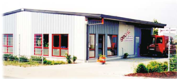
geonit - Filiale in Erfurt