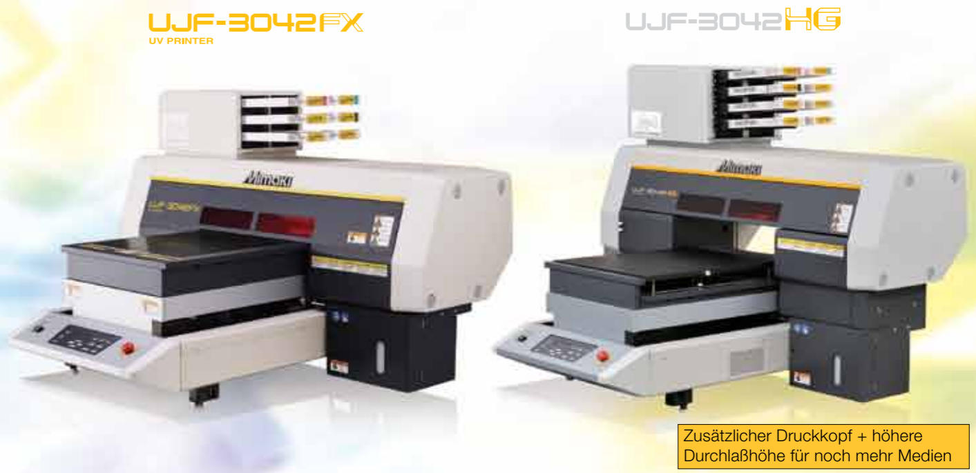
Zusätzlicher Druckkopf + höhere Durchlaßhöhe für noch mehr Medien